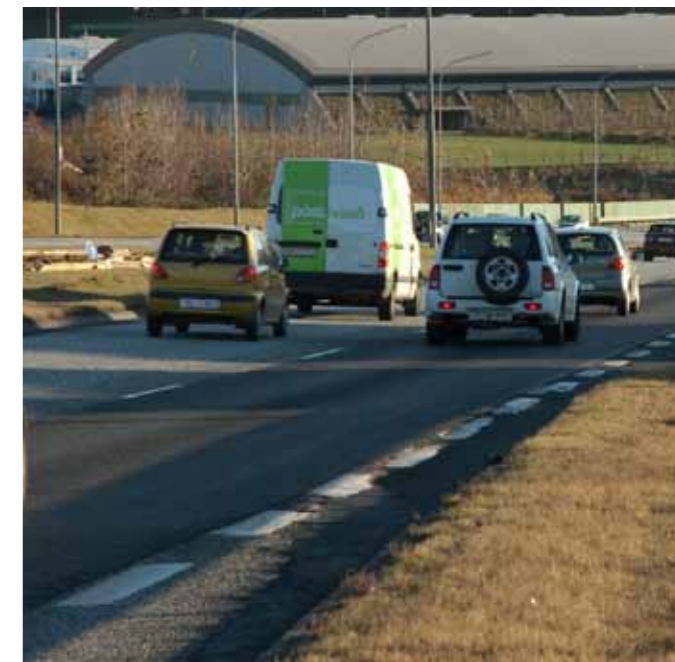
Lagfæring á þessari aðrein á Hafnarfjarðarvegi er auglýst í útboð hér í þessu blaði.