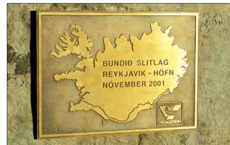
Saga vegagerðar á Íslandi er órjúfanlega tengd heiti stofnunarinnar.