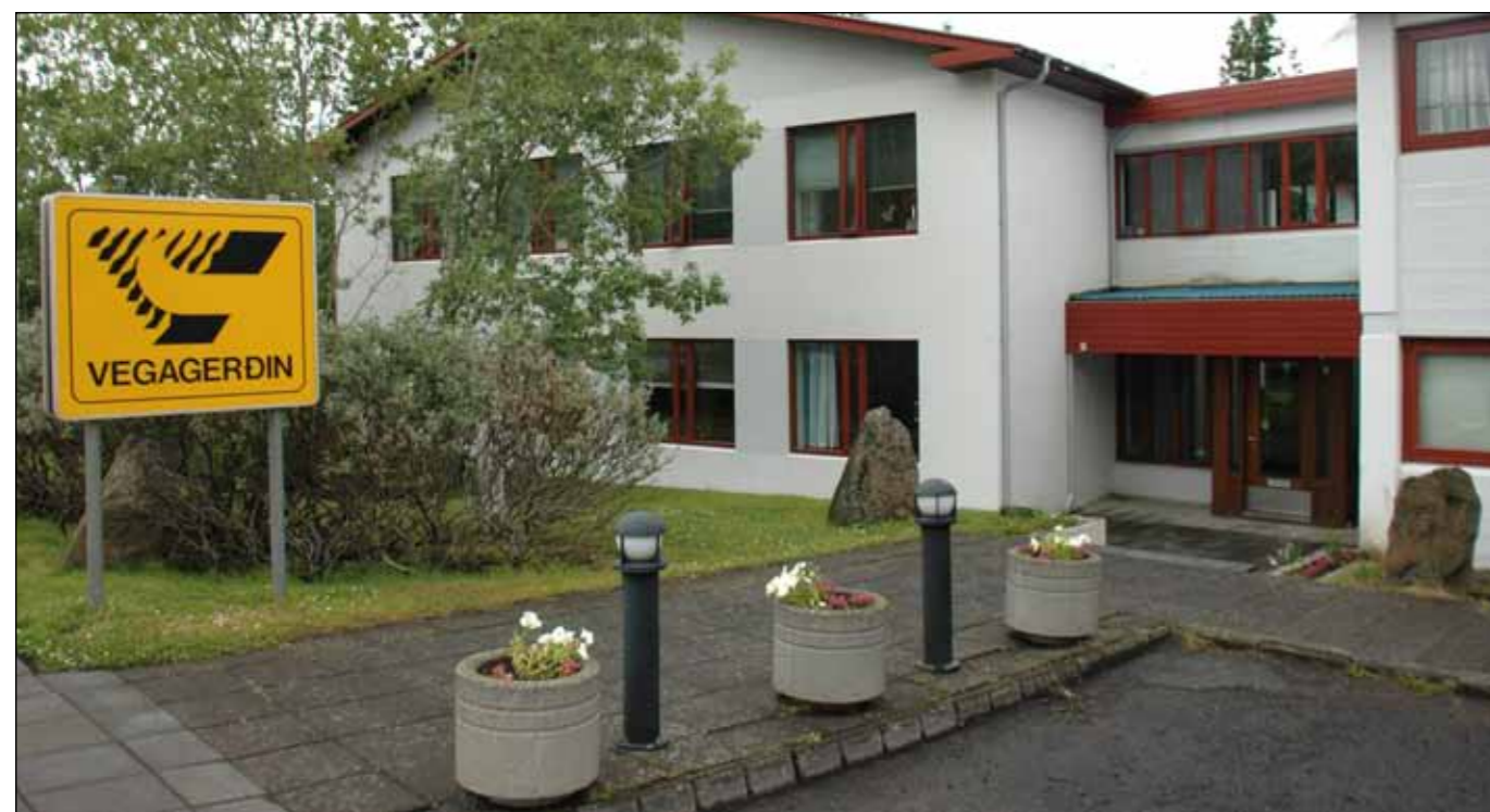
Starfsstöð Vegagerðarinnar á Reyðarfirði. Allar starfsstöðvar Vegagerðarinnar á landinu, 21 að tölu, eru merktar stofnuninni.