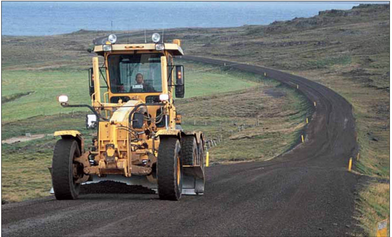
Innstrandavegur (68) í Hrítafirði, áður Djúpvegur (61).