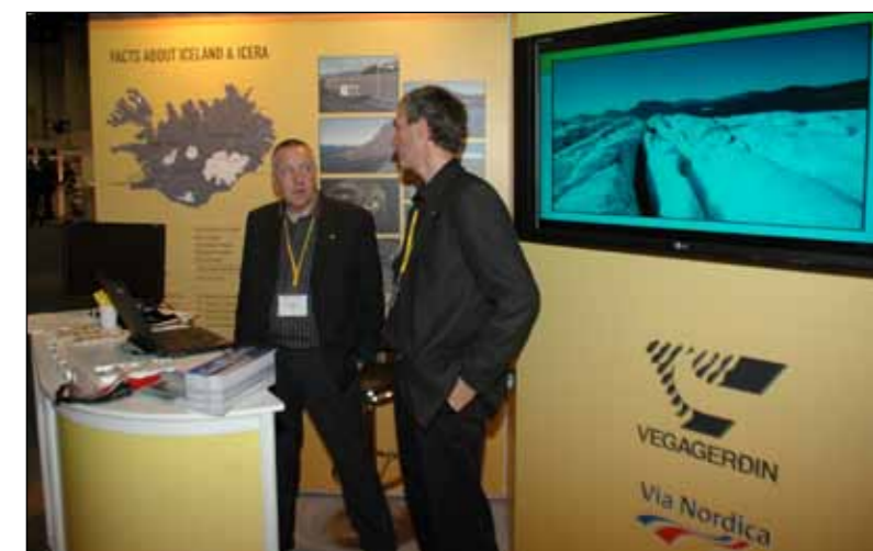
Via Nordica ráðstefna NVF 2012 er markaðssett erlendis með nafni og merki Vegagerðarinnar. Rúmlega 1.200 gestir eru væntanlegir.

Flestir starfsmenn Vegagerðarinnar munu sitja á sömu skrifborðsstólunum og við sömu skrifborðin og áður. Nothæfum húsgögnum verður auðvitað ekki skipt út. Við höfum nafn og merki sem enn eru vel boðleg og kosta okkur ekkert. Spörum okkur kostnað við nýtt nafn og hendum ekki barninu út með baðvatninu. ■